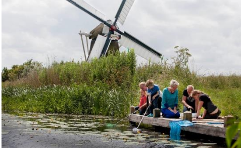
foto te gaan met je huisdier bij/ in de molen, een lezing over de vogels in de omgeving van de (polder) molen, kinderen hun huisdier (naast gewone ook exoten als slangen, woestijnratjes, schildpadden) laten showen, het voorlezen van het boek ‘de molenmuis’. Natuurlijk is ‘gewoon’ open zijn voor het publiek, en als het mogelijk is met een draaiende molen, ook goed.

Molenorganisaties zullen worden uitgenodigd ‘iets’ met het thema te doen, bijvoorbeeld op de