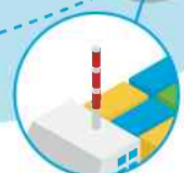
Situatie 's nachts